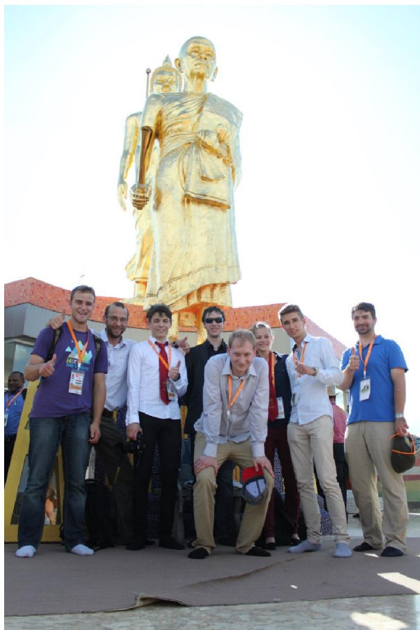
A magyar csapat az elefánt szentély tetején