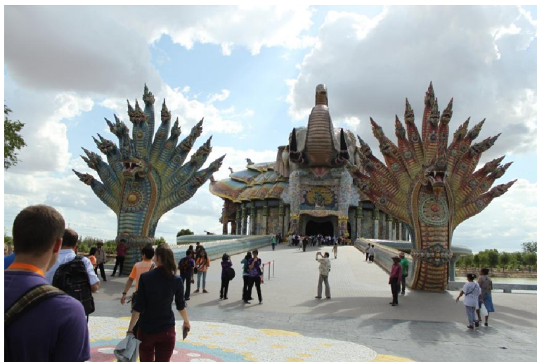
Wat Non Kum elefánt alakú buddhista szentély