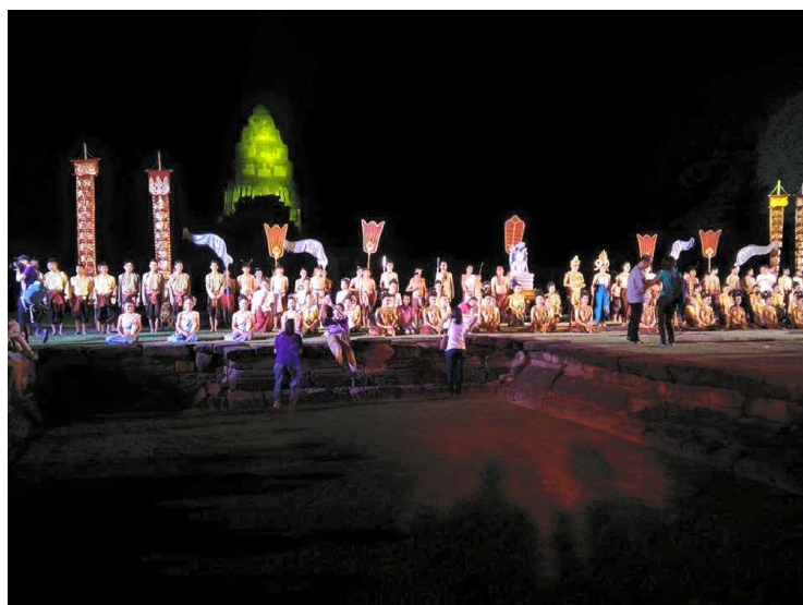
A gálaműsor szereplői háttérben zöld fénnel megvilágítva a Phimai templom főépülete.