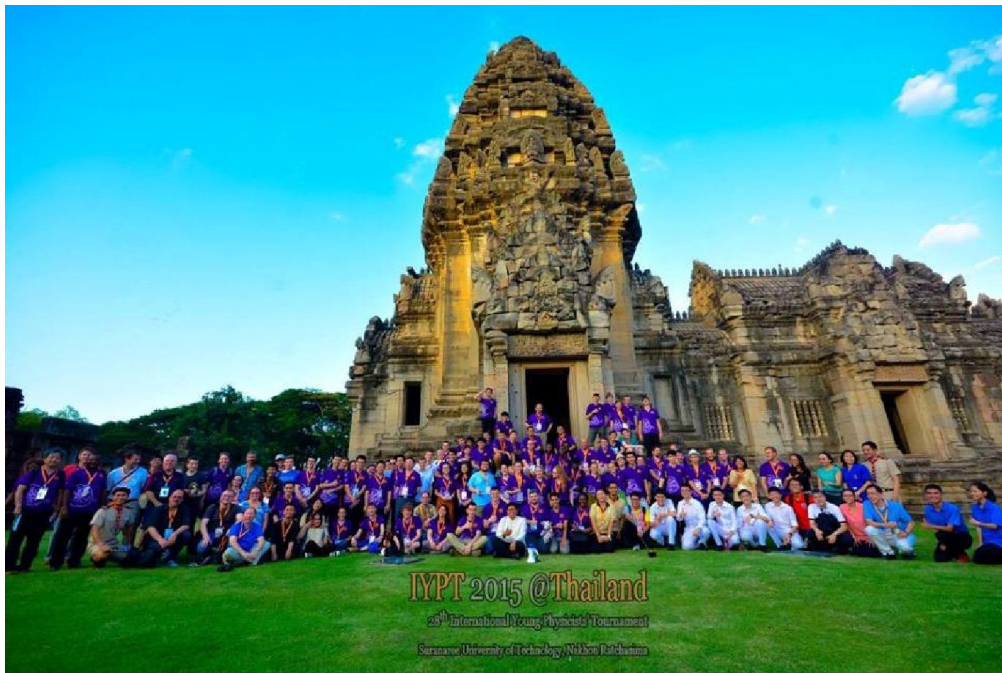
A 27. IYPT verseny résztvevői a Phimai Történelmi Parkban

szerepelt a kutatásaik prezentációjában, az angol nyelv használatában, a vita és a csapatmunka terén is, hiszen sikerrel opponáltak és értékelték az ellenfél csapatok prezentációit.