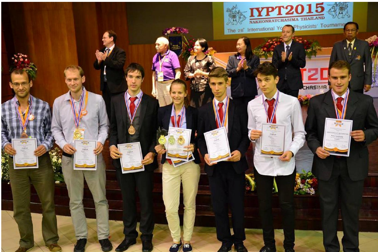
A legjobb bronzérmes csapat.

Az idén 27. alkalommal megrendezett Ifjú Fizikusok Nemzetközi Versenyén (eredetileg: International Young Physicists' Tournament, röviden: IYPT) a magyar csapat a legjobb bronzérmes helyezést érte el a thaiföldi Nakhon Ratchasima-ban 2015. június 27. és július 4. között rendezett versenyen. Az egész éves felkészülés sikeres lezárása mellett, a remek szervezésnek köszönhetően sikerült belekóstolni a thaiföldi kultúrába és hétköznapiakba is.